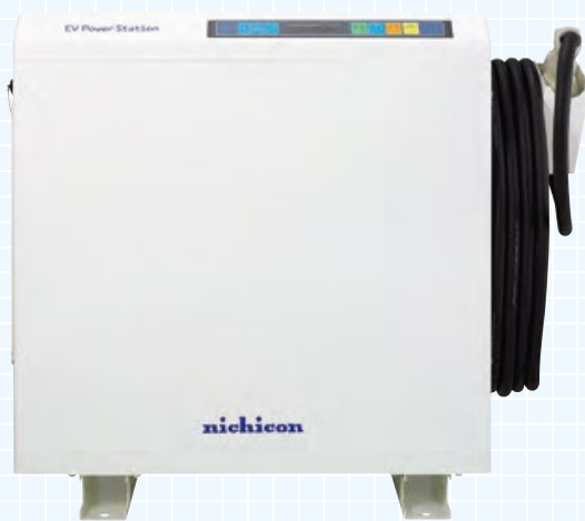
nichicon プレミアムモデル VCG-666CN7