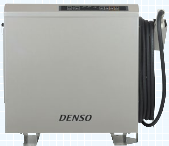
DENSO Crafting the Core DNEVC-D6075

「V2H」とは「Vehicle to Home」の略で、電気自動車を充電するだけでなく、貯めた電気をご家庭で使用する仕組みです。