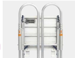
手すりをたたんで収納可能