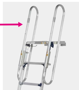
手すりを裏表どちらでも設置可