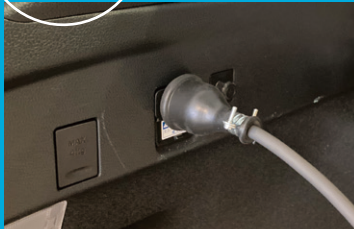
ACコンセントを確認し(100V 1,500W) 屋外電源用ケーブルをコンセントに挿す