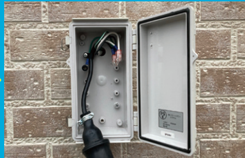
屋外電源入力BOXに繋ぐ